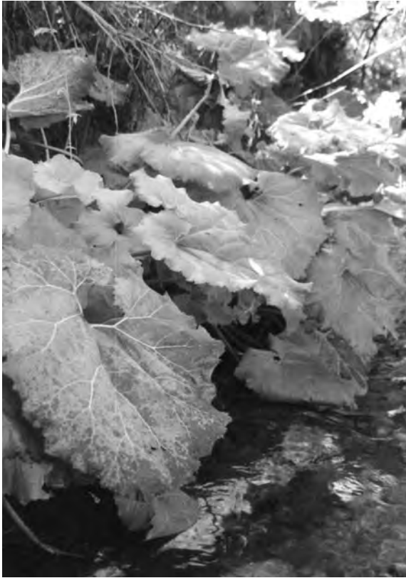
Fig. 1 Un aspetto del popolamento di Petasites hybridus di Rocche Palazzolo, in estate al culmine dell'attività vegetativa. La lamina fogliare raggiunge il diametro di 60 cm. A view of the population of Petasites hybridus of Rocche Palazzolo, in summer at the top of its luxuriance. In many individuals the leaf-blade goes up to 60 cm in diameter.

cumboreali, eurosiberiane ed in parte eurasiatiche) che prolungano i loro areali fin dentro il Mediterraneo, favorite in ciò dalla presenza di dorsali montane (nel caso specifico l'Appennino). Queste consentono l'esistenza di habitat che in qualche misura riproducono le condizioni di umidità anche estiva dell'area continentale europea in cui tali specie hanno il loro optimum ecologico. Condizioni climatiche molto simili a quelle appenniniche, e quindi favorevoli all'insediamento delle specie anzidette, si hanno in Sicilia in corrispondenza della dorsale peloritana. In questa appunto in ambito collinare e montano* il bioclina è riconducibile, sulla base del criterio di Rivas Martinez (1981), per il 60.8% dell'area al tipo termomediterraneo-subumido (elaborazioni su dati Brullo & Spampinato, 1990: 13), mentre in altri territori a rilievo pure più accentuato come Nebrodi e Madonie questo tipo bioclimatico occupa aree molto esigue (rispettivamente il 16.4 % e il 16.5 %). E' su questa base, oltre ovviamente che per l'evidente contiguità territoriale, che proprio sui Peloritani troviamo molte specie in comune con la flora calabrese e appenninica in genere, assenti dal resto della Sicilia. Dalla nostra elaborazione dei dati bibliografici (Pignatti 1982; Brullo & al. 1996;